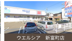
ウエルシア 新富町店