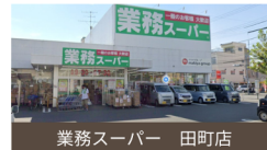
業務スーパー 田町店